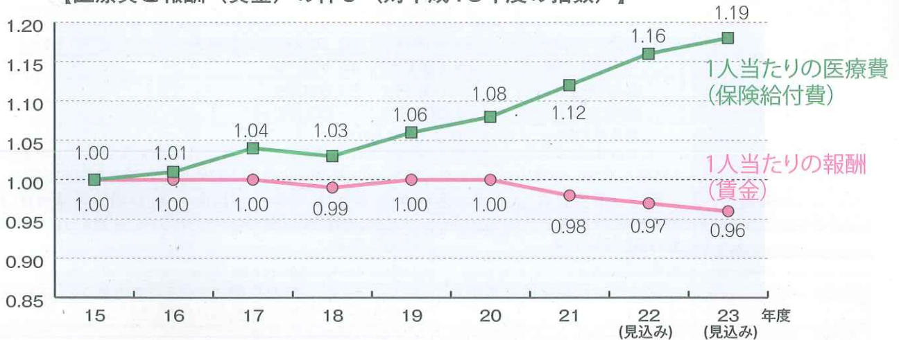
【医療費と報酬（賃金）の伸び（対平成15年度の指数）】

平成18年度に5,000億円あった準備金は、21年度末には▲3,200億円の赤字に陥りました。22年度から24年度末までの間に返済しなければなりません。