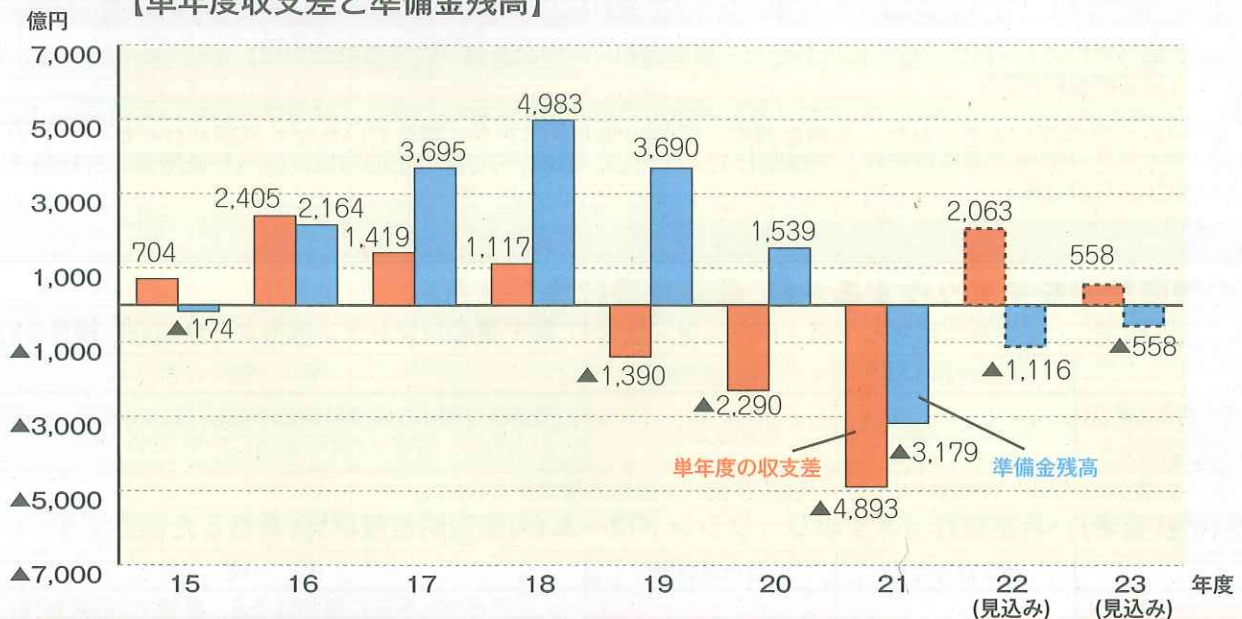
【単年度収支差と準備金残高】

平成18年度に5,000億円あった準備金は、21年度末には▲3,200億円の赤字に陥りました。22年度から24年度末までの間に返済しなければなりません。