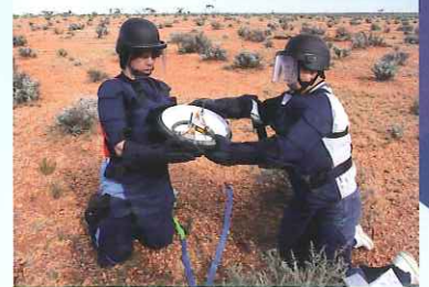
はやぶさカプセルヒートシールドの回収