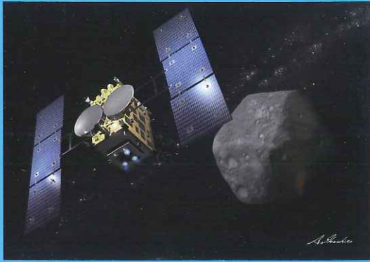
はやぶさ2の想像図 クレジット：池下章裕氏

2010年6月13日に、日本が誇る・小惑星探査機「はやぶさ」が、7年間・60億kmの宇宙の旅を終え、小惑星イトカワの表面サンプルを持ち帰りました。宇宙の壮大さ、夢に思いを馳せました。